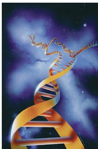
Datenträger DNA: Generika-Unternehmen engagieren sich zunehmend in der Genforschung

Generika und Forschung – ein Widerspruch? Nie gewesen. Mit galenischer Forschung, also die Suche nach verträglicheren Zubereitungen bekannter Medikamente, konnten Generika-Hersteller schon immer punkten. Und nun engagieren sie sich verstärkt in der Genforschung.