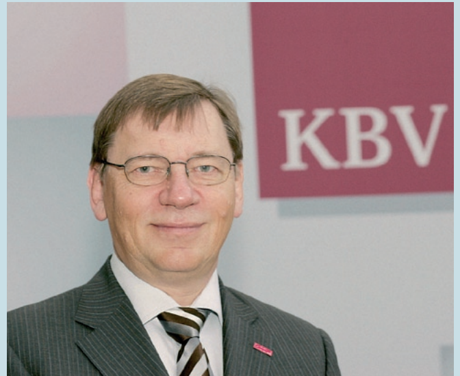
Ulrich Weigeldt

Gerade wegen dieses ungebrochenen Bezugs zum Praxisalltag lässt er Kritik am Verschreibungsverhalten der Ärzte nicht gelten: Zum einen verordnen sie Medikamente, um zu heilen. Zum zweiten müssten sie im Zweifel dafür mit ihrem Privatvermögen gerade stehen. Allerdings wünscht sich Weigeldt, dass auch die Kassenärztlichen Vereinigungen (KVen) mehr über Medikamente informieren dürfen – auch über Preise. Denn für